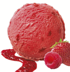
RASPBERRY & STRAWBERRY