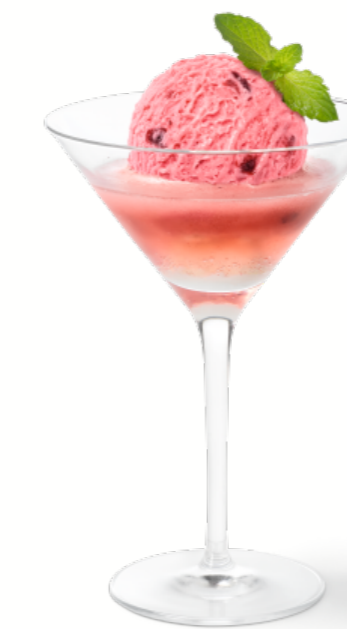
ZWETSCHGENSORBET MIT SCHUSS

Strawberry Ice Cream und Raspberry & Strawberry Sorbet, Rahm, Erdbeersauce 3 Kugeln Fr. 12.50